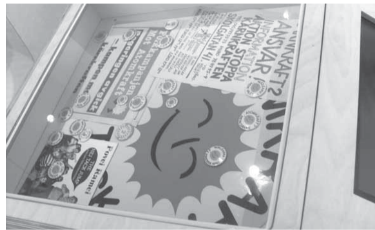
Folkkampanjen har lånat ut lite av sitt material till utställningen.

Text och foto: Jan Ternhag Se: www.tekniskamuseet.se